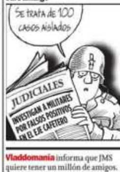
Vladomania informa que JMS quiere tener un millón de amigos.