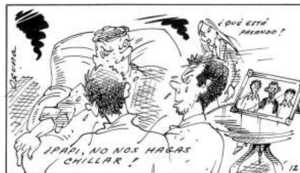
Los ricos también lloran