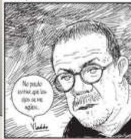
Vladdomania se pregunta si las 'monas' del álbum de Pablo Escobar son prepaço...