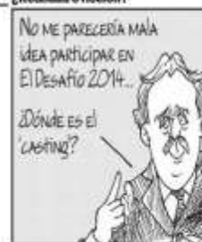
Vladomania nos sale del hombro con la historia de Reichel-Dolmatoff.