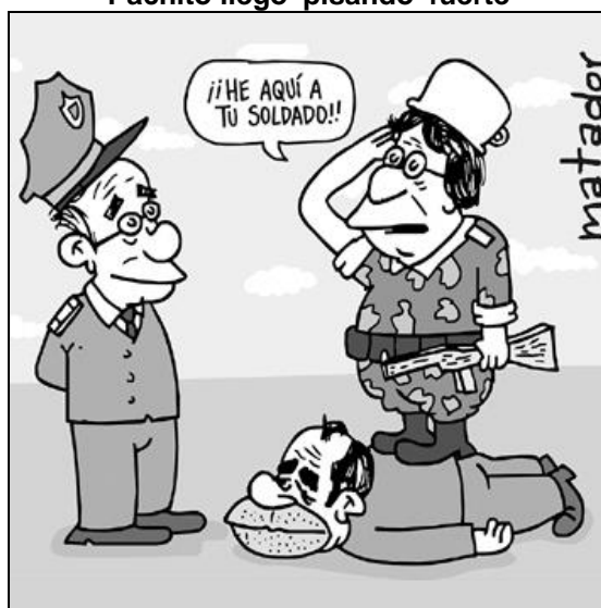
Pachito llegó 'pisando' fuerte