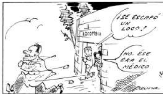
Se le colmó la paciencia