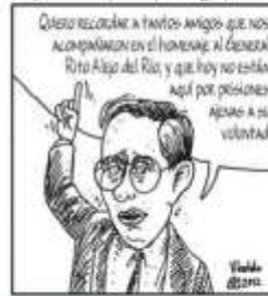
Vinlandomaniá se pregunta si el General Santoyo es el policía mejor extraditado del mundo.