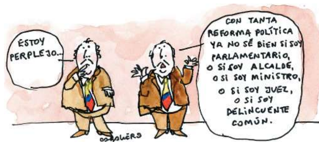
Palabras, palabras, palabras...

Siete de cada 100 pacientes de países desarrollados adquieren algún tipo de infección porque sus médicos no se lavan adecuadamente las manos, según informó la Organización Mundial de la Salud (OMS), entidad que agregó que la cifra puede aumentar a diez en países subdesarrollados. Por eso, y con motivo de la celebración del Día de la Higiene de Manos, la OMS promovió la realización de campañas como Salva Vidas: Lávate las Manos. Esta iniciativa busca que los 500, de los 2.000 centros hospitalarios analizados en 69 países del mundo, que no cuentan con la promoción de este proyecto se puedan unir a la consigna de transmitir vida y no gérmenes, para mantener la seguridad y salubridad de los pacientes y de la comunidad en general.