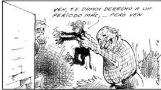
El articulo convertido en mico.