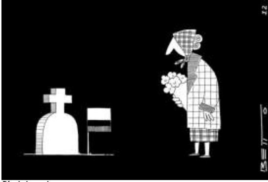
Día de la madre.