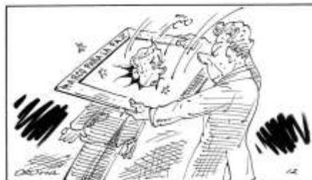
Tanto va el cántaro al agua