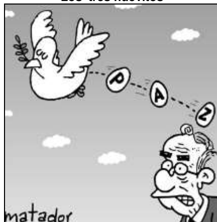
Los 'tres huevitos'